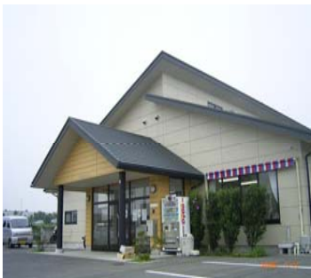
存続が危ぶまれる精神障害者の地域生活支援センター

また、施設・事業にたいする報酬単価が四月から引き下げられ、支払い方式も月額制から日額制に変更されました。また、精神障害者の地域生活支援センターへの補